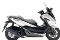
Mat Pearl Cool White