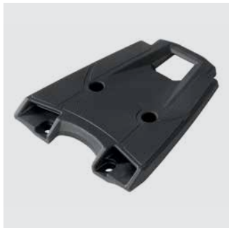
HÁTSÓ DOBOZ TARTÓ 08L71-MGZ-J01

35 l kapacitású hátsó doboz, melybe 1 zárt sisakon túl sok más is belefér. A fedél Mat Cynos Grey színre van fújva. Gyorszáras és könnyen levehető. A zárhengszett és a tartó külön kapható.