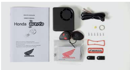
AVERTO RIASZTÓ SZETT 08E70-MGH-640

Ez a kompakt riasztó 118 db-es szirénával, mozgás- és rázkódás-érzékelővel, valamint 8 fokozatban állítható érzékenységgel különleges védelmet garantál. A belső tartalek akkumulátor és a kist fogyasztási alvó üzemmód garantálják az akkumulátor lemerülése elleni védelmét. Csak a következőkkel együtt használható: - Riasztó beszerelő szett (08E70-MKH-D20)* - Mágneskapcsoló (08E70-MCS-G40)* *Külön kapható