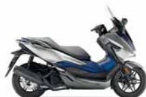
Mat Lucent Silver Metallic