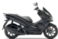
Mat Carbonium Gray Metallic