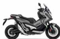
Mat Bullet Silver