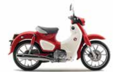
Pearl Nebula Red

Krómozott, csúcsminőségű hátsó csomagtartó, amely stabil tárolóhelyet biztosít csomagjainak.