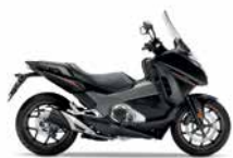
Mat Ballistic Black Metallic