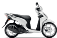
Pearl Cool White