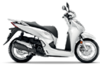
Pearl Cool White