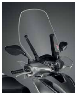
SZÉLVÉDŐ SZETT 08R70-K53-D00

Háromrészes lekerekített, polikarbonát szélvédő, átlátszó markolatvédőkkel. Magasság: 46 cm.