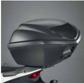
35 LITERES HÁTSÓ DOBOZ 08L71-KZL-861ZA

35 l kapacitású hátsó doboz, melybe 1 zárt sisakon túl sok más is belefér. A fedél Mat Cynos Grey színre van fújva. Gyorszáras és könnyen levehető. A zárhengszett és a tartó külön kapható.