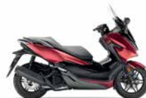
Mat Carnelian Red Metallic