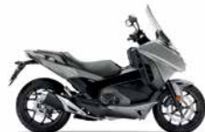
Mat Alpha Silver Metallic