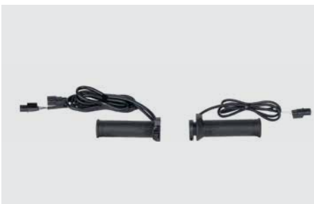
MARKOLATFŰTÉS SZETT 08HGA-KTW-16HG

2 méretben kapható: Standard (08T56-KTF-800), XL (08T56-KTF-800A)