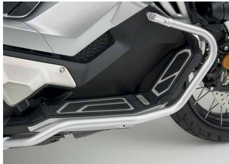
FELLÉPŐ SZETT 08F70-MKH-D00

A kipufogó alapja rozsdamentes acél, a külső hüvely titánium, a végzáró elem pedig karbon. Utcai használatra engedélyezett.