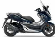
Crescent Blue Metallic