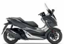
Mat Cynos Grey Metallic