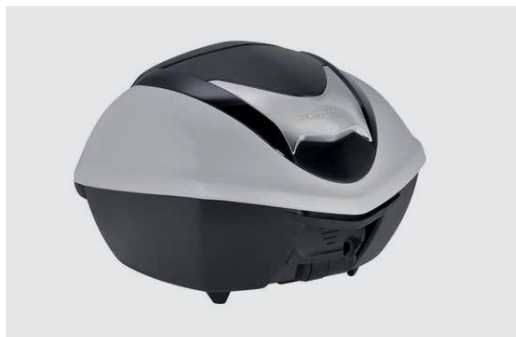
35 LITERES SMART HÁTSÓ DOBOZ SZETT 08ESY-K53-TB19ZA, B, C, D, F VAGY G

35 liter űrtartalom. Egy zárt vagy két nyitott sisakot képes befogadni, gyorszáras, könnyedén leszerelhető. Hátpárnával és hátsó tartóval. A hátsó dobozfedél az SH300I fényezéséhez illő színekben kapható.