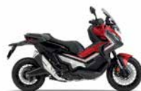
Grand Prix Red