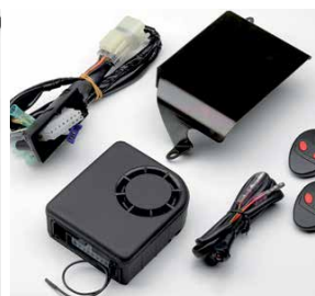
SPYBALL RIASZTÓ SZETT 08E50-EWN-800E

Lehetővé teszi a hátsó ülés levételét anélkül, hogy az Averno riasztórendszer bekapcsolna.