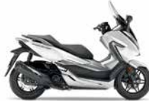
Mat Pearl Cool White