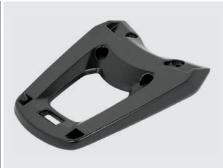
HÁTSÓ DOBOZ TARTÓ 08L71-K35-J01

35 l kapacitású hátsó doboz, melybe 1 zárt sisakon túl sok más is belefér. A fedél Mat Cynos Grey színre van fújva. Gyorszáras, könnyedén leszerelhető. A készlet tartalmazza a 35 literes hátsó dobozt, a tartót és a zárszettet.