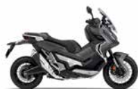
Mat Moonstone Silver Metallic