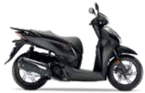
Mat Cynos Grey Metallic