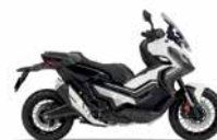
Mat Pearl Glare White