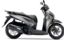
Mat Ruthenium Silver Metallic