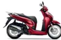
Pearl Splendor Red