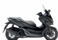
Mat Cynos Grey Metallic