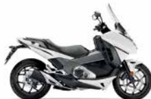
Pearl Glare White