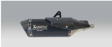
AKRAPOVIČ KIPUFOGÓDOB (*) 08F88-MKH-900

Utcai használatra engedélyezett kipufogódob rozsdamentes acélból (be- és kiömlő), titániumból (külső hüvely) és karbonszálas anyagból (végzáró elem). Alacsony fordulatszámon jobban reagál a motor, és szebb a hangja.