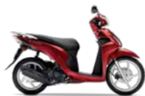
Pearl Splendor Red