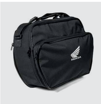
35 LITERES HÁTSÓ DOBOZ BELSŐ TÁSKA

35 liter űrtartalom. Egy zárt vagy két nyitott sisakot képes befogadni, gyorszáras, könnyedén leszerelhető. Hátpárnával és hátsó tartóval. A hátsó dobozfedél az SH300I fényezéséhez illő színekben kapható.