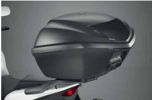
35 LITERES HÁTSÓ DOBOZ SZETT 08ESY-K96-TB18

35 l kapacitású hátsó doboz, melybe 1 zárt sisakon túl sok más is belefér. A fedél Mat Cynos Grey színre van fújva. Gyorszáras, könnyedén leszerelhető. A készlet tartalmazza a 35 literes hátsó dobozt, a tartót és a zárszettet.