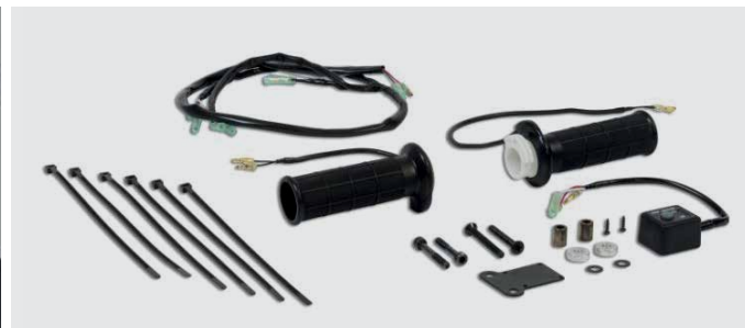
MARKOLATFŰTÉS SZETT 08T70-K96-J00

Kifejezetten a PCX 125-höz készült ez a sportos szélvédő, mely remekül kiegészíti a robogó stílusos megjelenését. Méretek: 566*466*4 mm. A felszereléshez szükséges összes alkatrészt tartalmazza.