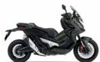
Mat Armored Green Metallic