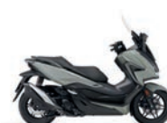
Új szín Pearl Falcon Grey