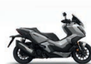
Spangle Silver Metallic