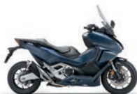
Matt Jeans Blue Metallic