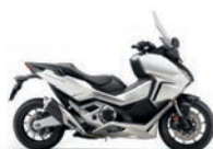
Matt Beta Silver Metallic