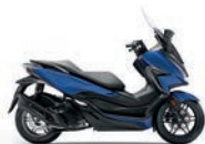
Új szín Matt Pearl Pacific Blue