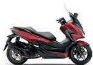
Matt Carnelian Red Metallic