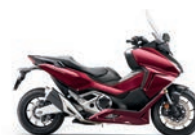
Candy Chromosphere Red