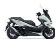
Új szín Pearl Cool White