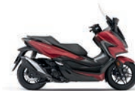
Új szín Matt Carnelian Red Metallic