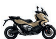
Új szín Harvest Beige