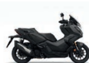
Matt Carbonium Grey Metallic