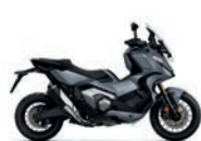
Új szín Matt Iridium Grey Metallic