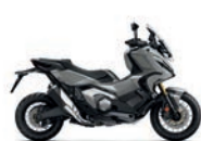
Pearl Deep Mud Grey