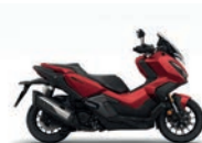
Matt Carnelian Red Metallic