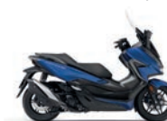
Új szín Matt Pearl Pacific Blue