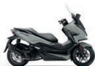
Új szín Pearl Falcon Grey